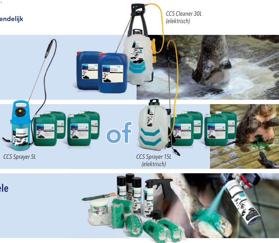
CCS Cleaner 30L (elektrisch)

Behandelen Individuele SHOTTLE® Spray 1) en Intra Hoof-fit Gel 2)