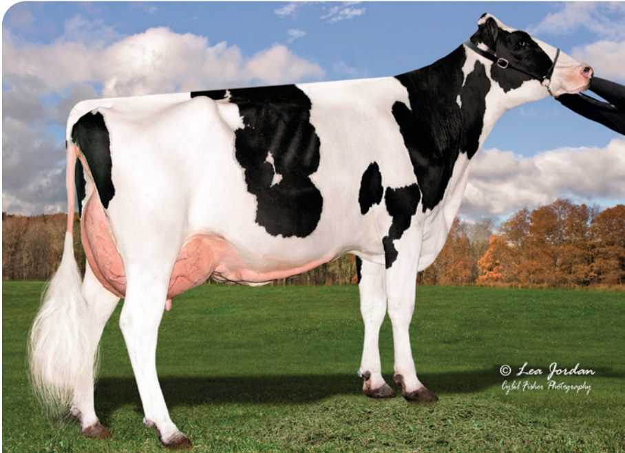
Moeder April Day Helix Tait-ET