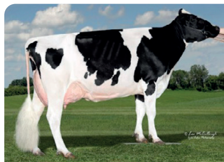
**OCD Planet Danica (EX93)