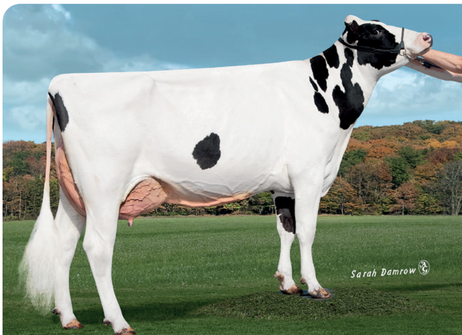
Overgrootmoeder Maximus: MS Delicious Mojo (EX90)