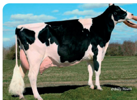
***Windsor Manor Zip (EX95)